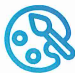
Imagen totalmente renovada

En Tirant Prime encontrará todos los servicios que tenía contratados , mostrados de una manera más usable y cercana. Con la calidad y el servicio de siempre.